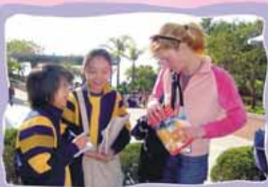
Do you like Chinese food, Miss?