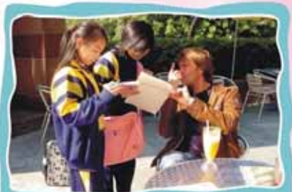
Do you speak Chinese?

此次為六年級英文科戶外學習活動。二零零五年十二月十九日（星期一），下午一時至三時三十分，三十多名六年級學生由老師帶領前往香港島太平山頂廣場，接觸外國僑民及遊客進行交談和訪問。目的讓學生有機會學以致用，增強其英語會話能力和信心。