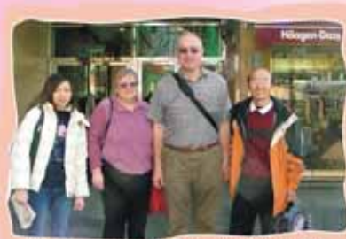
They are couple from America. It's their first visit to Hong Kong.