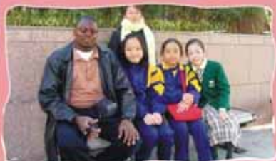
This gentleman is an NGO member from Zambia. He took part in the WTO Conference in Hong Kong.