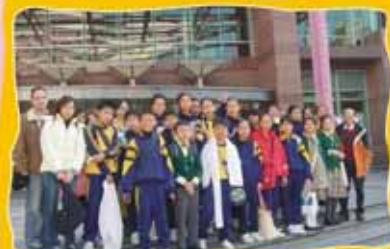
One, two, three Smile

此次為六年級英文科戶外學習活動。二零零五年十二月十九日（星期一），下午一時至三時三十分，三十多名六年級學生由老師帶領前往香港島太平山頂廣場，接觸外國僑民及遊客進行交談和訪問。目的讓學生有機會學以致用，增強其英語會話能力和信心。