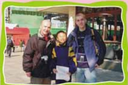
Boy! You speak quite good English. Let's take a photo together!